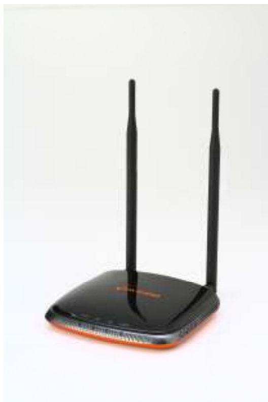
[Фиг. 1] Външен вид на продукта